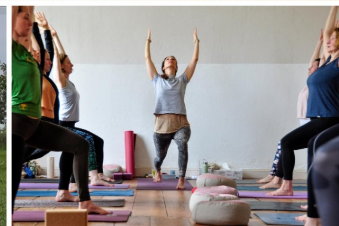
Yoga im Seminarraum des Gutshauses . Wie im Stall und der Scheune, kann auch dieser Raum ausgeräumt werden.