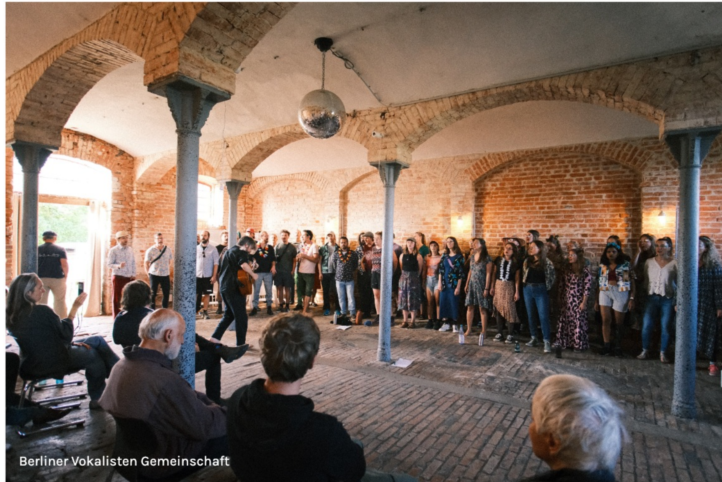
Berliner Vokalisten Gemeinschaft beim Proben im unteren Scheunengewölbe