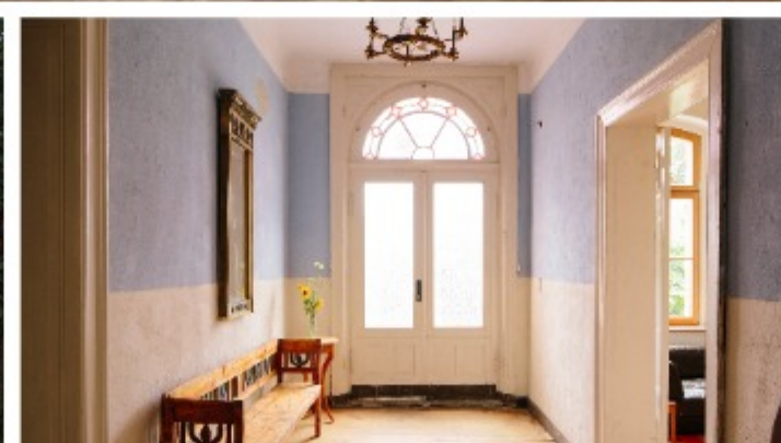
Die Zimmer sind in dem schlichten, poetischen Stil der Frühromantik eingerichtet worden.