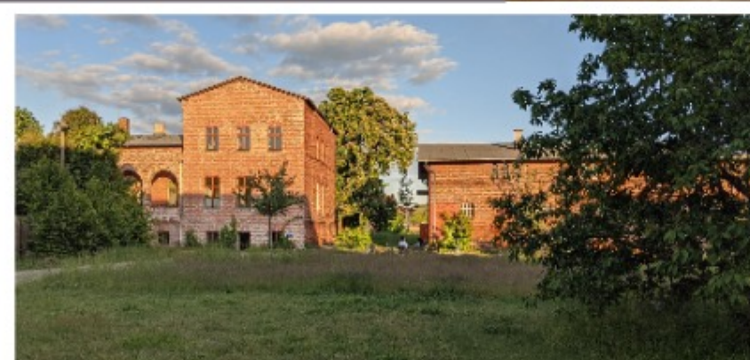
Das Landgut von vorne