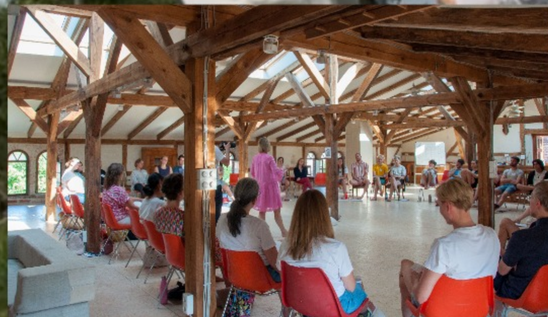
Die Zukunftsgesellschaft in der oberen Scheunenlounge.