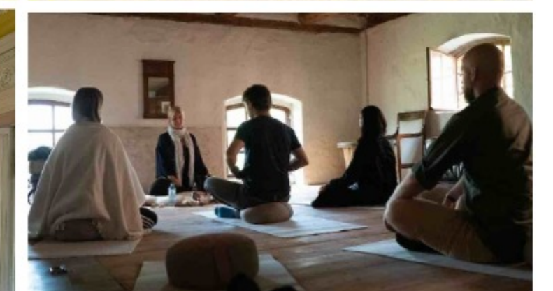
Vesper, Wellness und Meditation