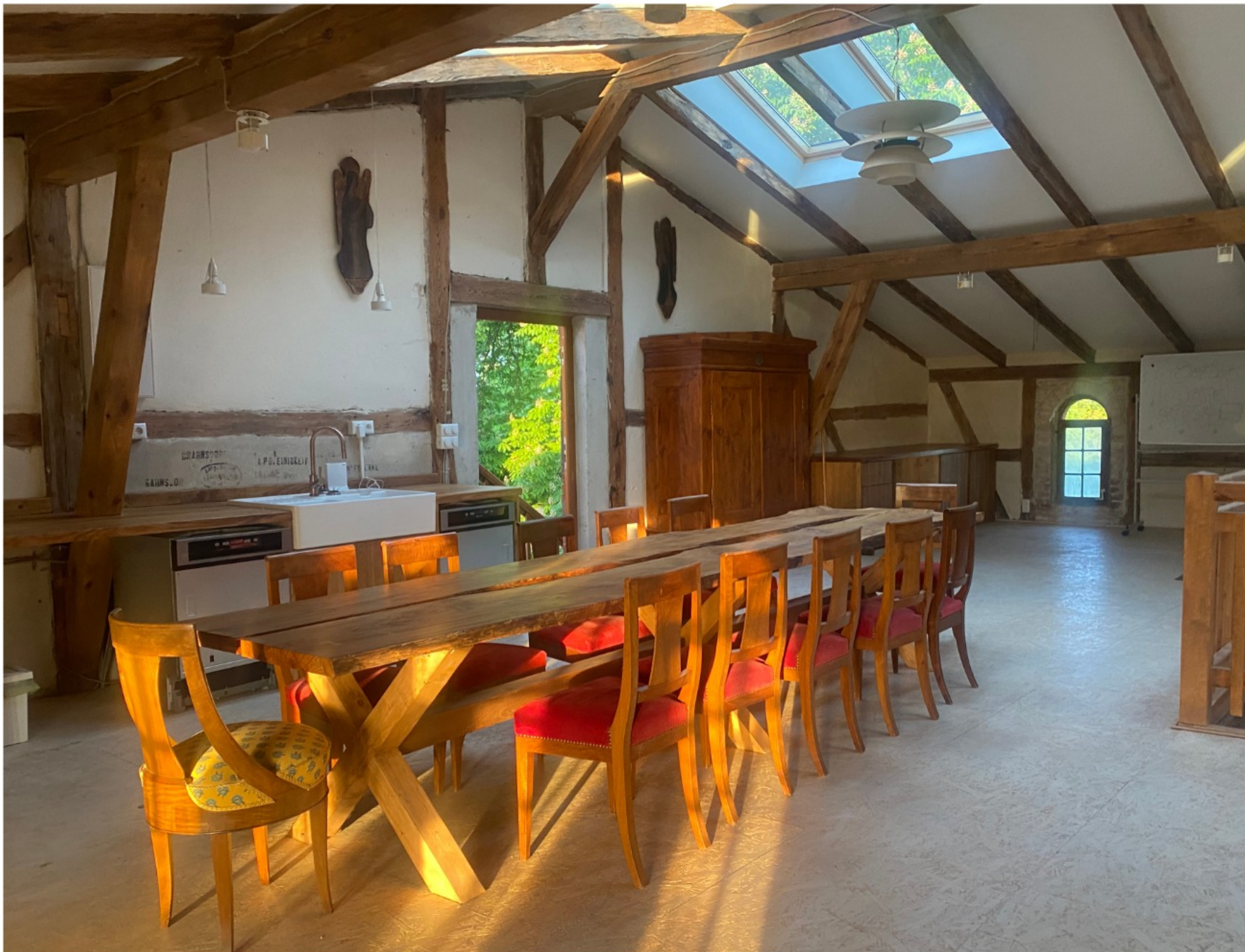
Die Küchenzeile in der Scheunenlounge

Die Dachfenster wurden neben die Balken gesetzt, für einen Schattenwurf, der an einen Wald erinnert.